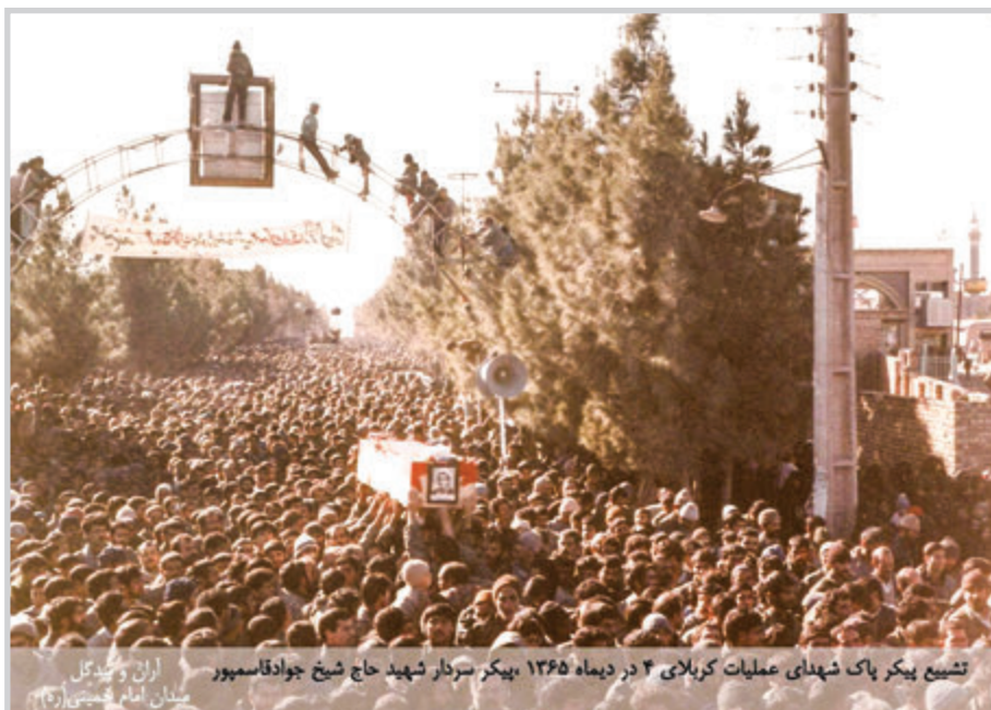
تشییع پیکر پاک شهدای عملیات کربلای ۴ در دیماه ۱۳۶۵، پیکر سردار شهید حاج شیخ جواد قاسمپور اراق و بغداد سلطان امام خمینی (ره)