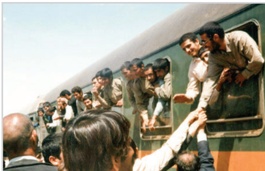
ایستگاه راه آهن کاشان