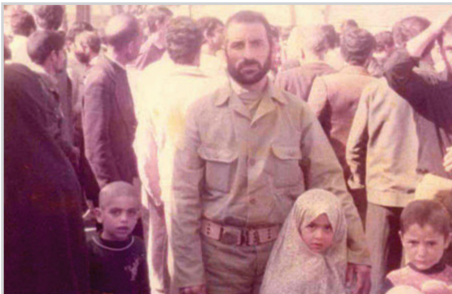
پیش از عملیات کربلای ۴