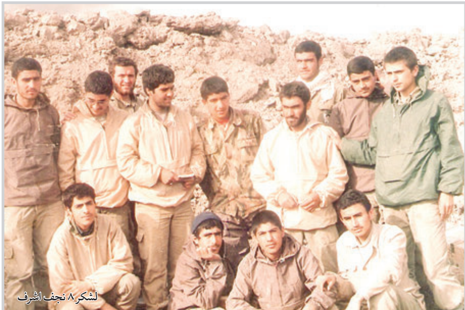
لشکر ۸ نجف اشرف