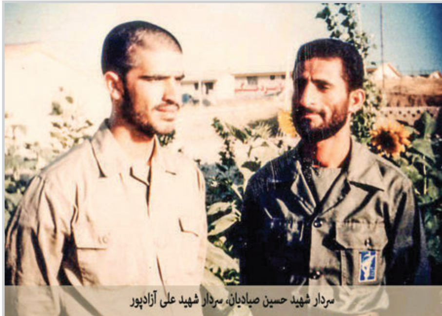
سردار شهید حسین صیادیان، سردار شهید علی آزادپور