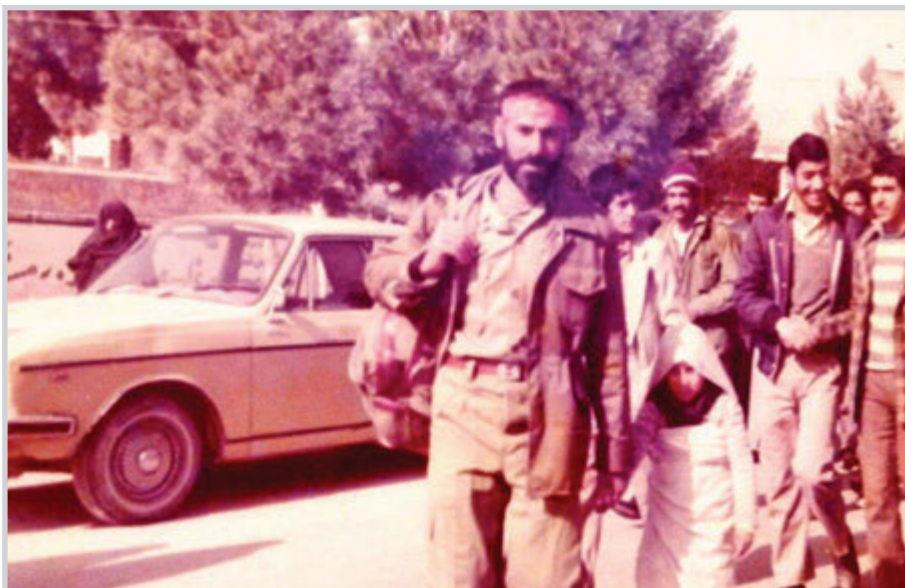
زمستان ۱۳۶۲ پیش از عملیات خیبر