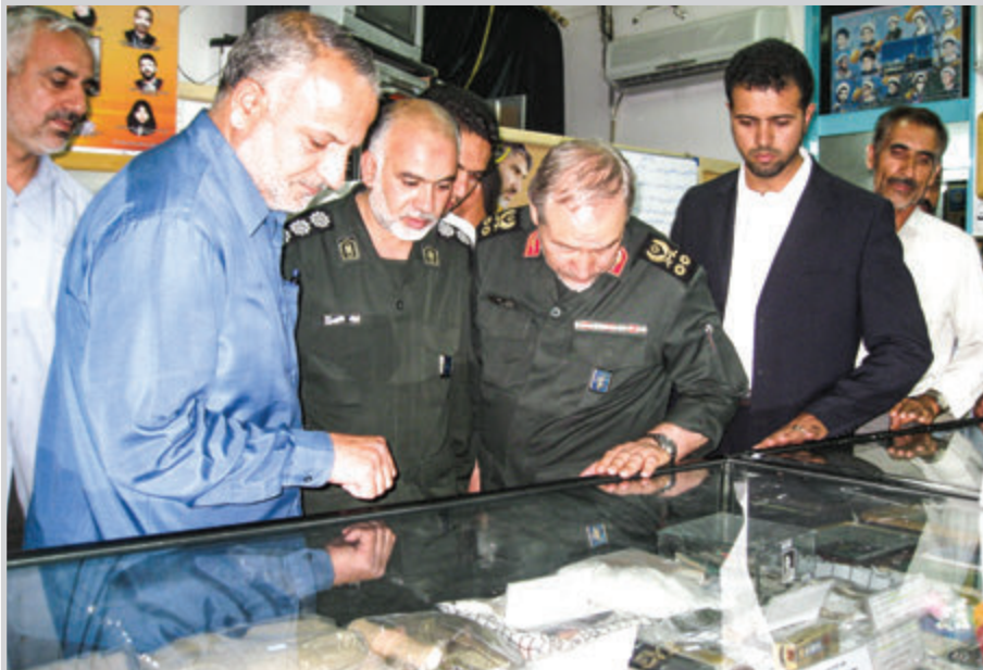
بازدید سردار سرلشکر سید رحیم صفوی دستیار ویژه فرمانده معظم کل قوا

از گنجینه انقلاب اسلامی، شهدا و دفاع مقدس شهرستان آران و بیدگل در حرم مطهر حضرت امامزاده محمد هلال ابن علی (ع) در تاریخ ۱۳۸۹/۰۴/۲۲